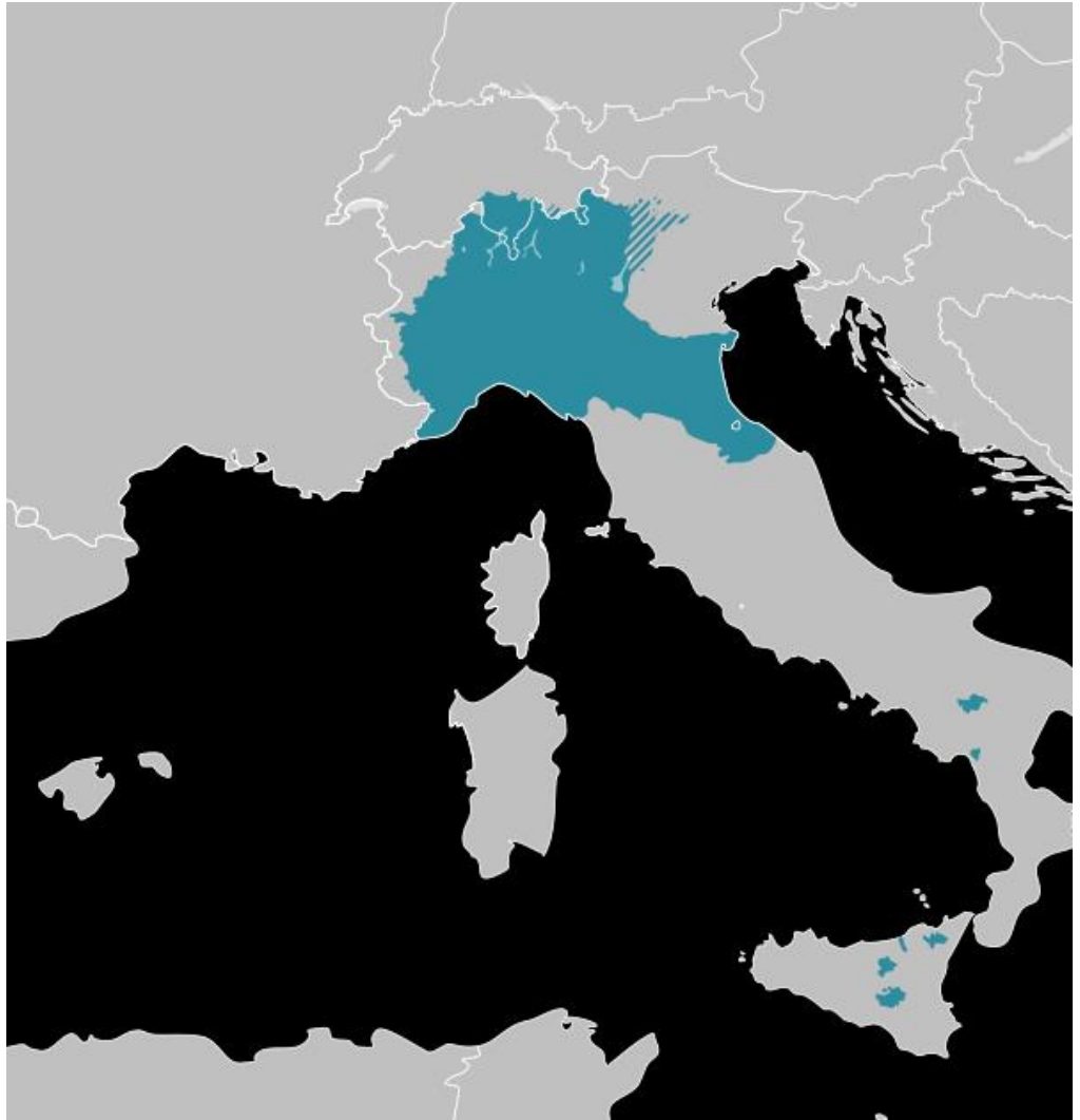
Distribuzione geografica delle varietà gallo-italiche

Chi fosse interessato a partecipare può inviare un'e-mail direttamente a Rocco Benedetto a