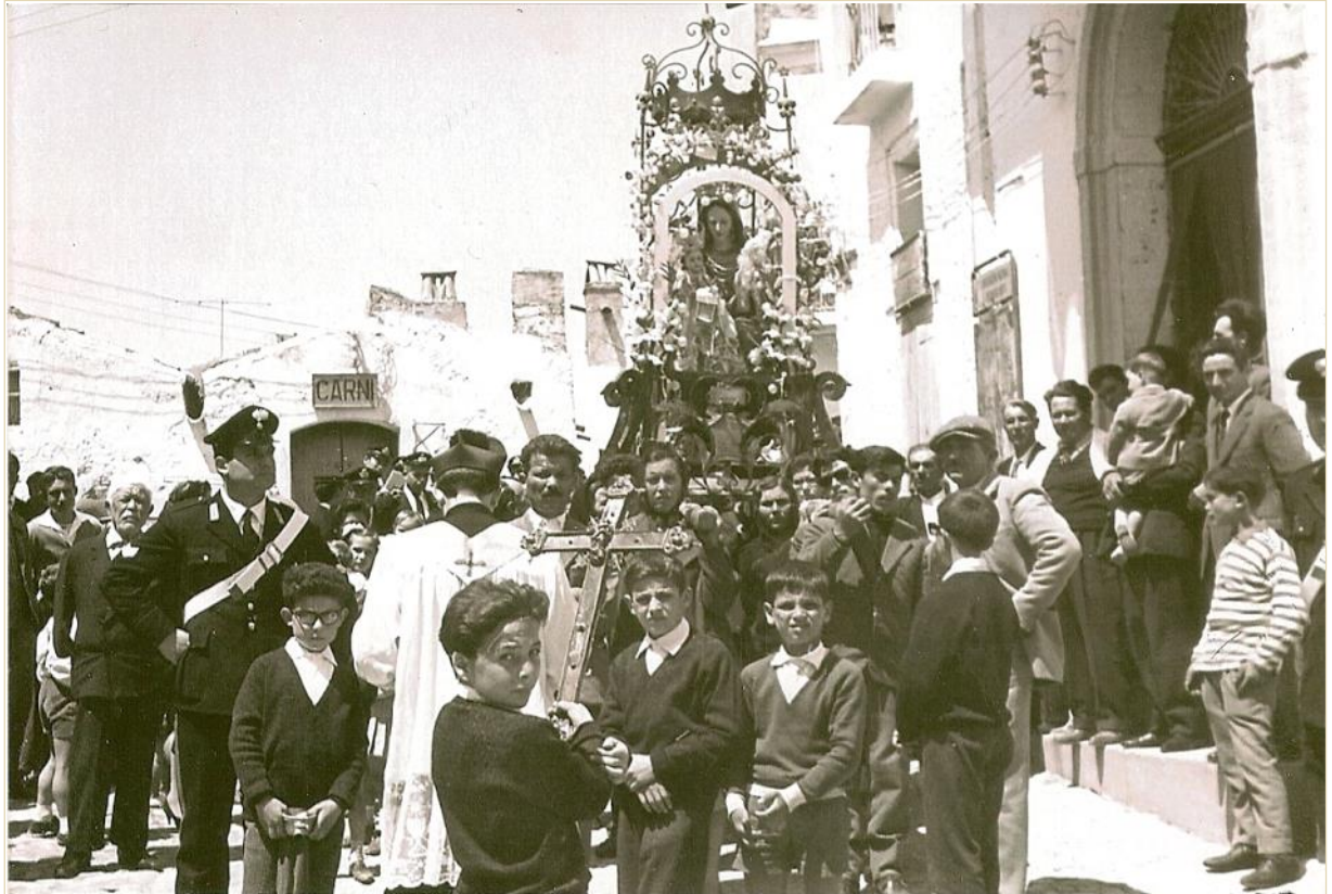
Processione Madonna della Stella 1962

Maggio è da sempre stato un mese particolarmente significativo e ricco d'attività a Craco vecchio.