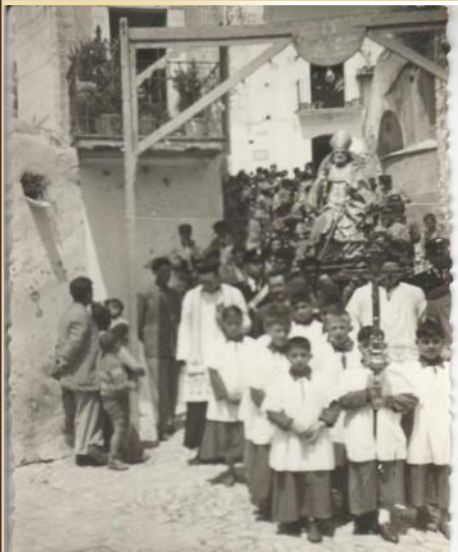
Processione San Nicola

Gli abitanti iniziavano a prepararsi per l'arrivo dei manovali, contadini che assistevano e lavoravano durante la raccolta del grano e che arrivavano fin da Lecce.