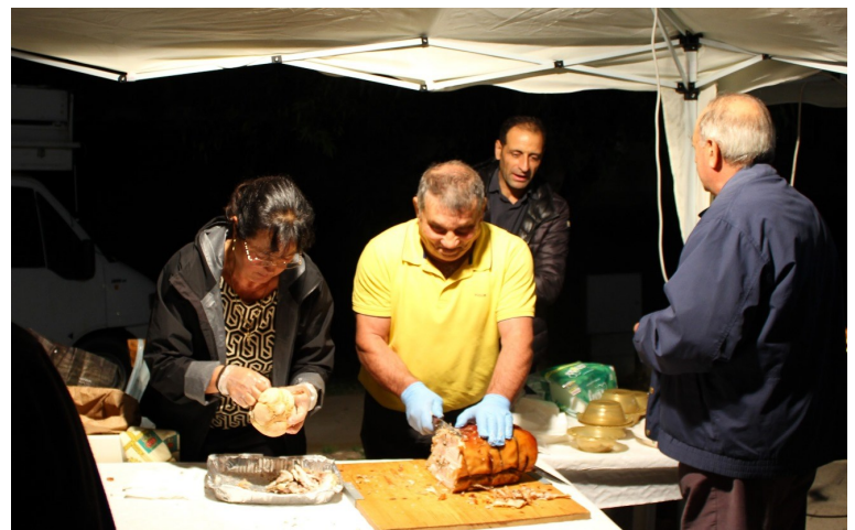
Date un'occhiata alle immagini di gioia che hanno caratterizzato la festa di San Vincenzo a Craco alle pagine 2 e 3.